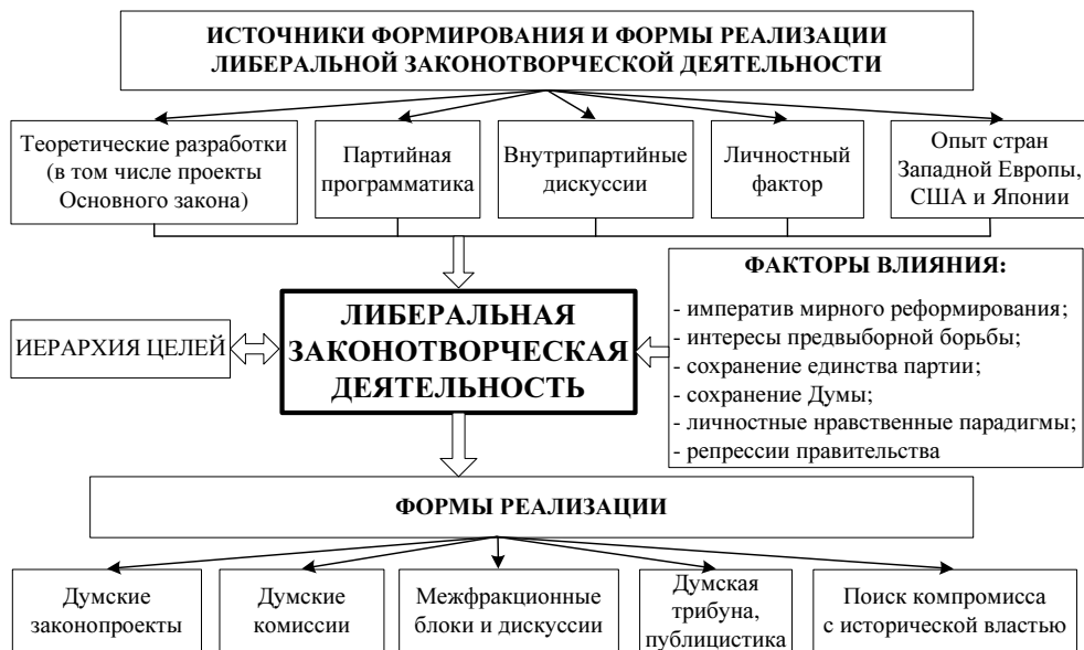
Рис. 3 Либеральная законотворческая деятельность