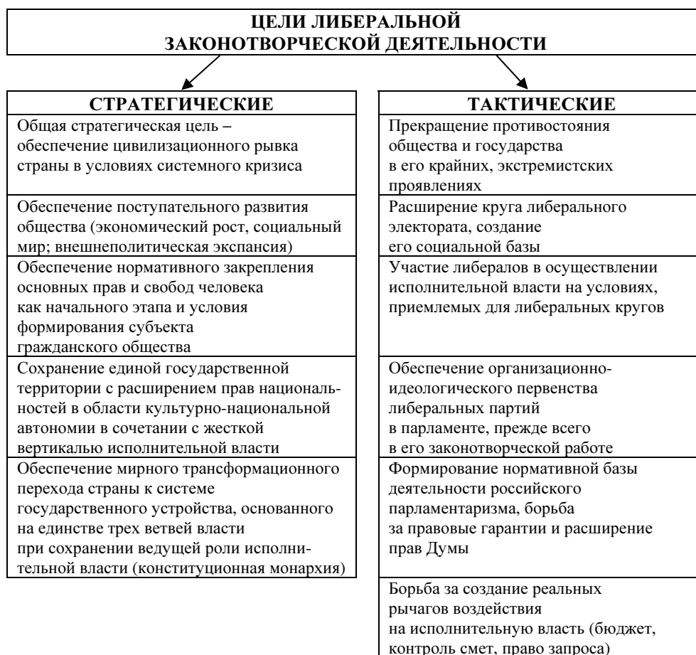
Рис. 1 Иерархия целей либеральной законотворческой деятельности

В настоящей статье предпринимается попытка в графическом виде представить основные структурно-логические связи, выявленные в ходе комплексного исследования либерального законотворчества думского периода (см. рис. 1–4). Автор вполне отдает себе отчет в том, что любое графическое представление является упрощением и влечет к абстрагированию от большинства частных деталей, тем не менее, представление в ограниченном объеме наиболее общих закономерностей такого масштабного явления, каким является либеральное законотворчество думского периода, представляется вполне оправданным и является приглашением к соответствующей дискуссии.